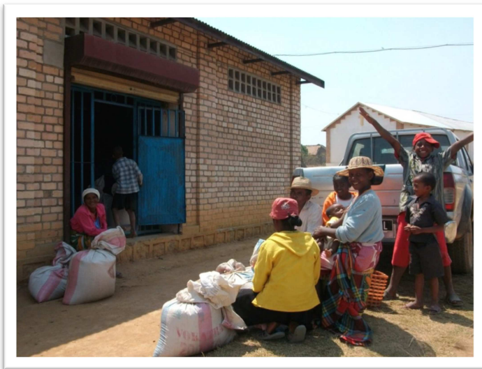
Exemple de silo malgache

Ce type de construction, habituel à Madagascar, permet de conserver le riz dans les meilleures conditions possibles, entre sa récolte et sa revente.